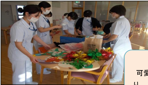
手作りの飾りつけや 可愛いバルーンなどを持ち寄り、手際よく作業が進みます。