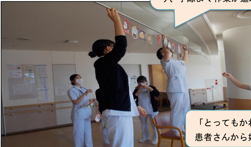
「とってもかわいい！」と 患者さんから好評でした。