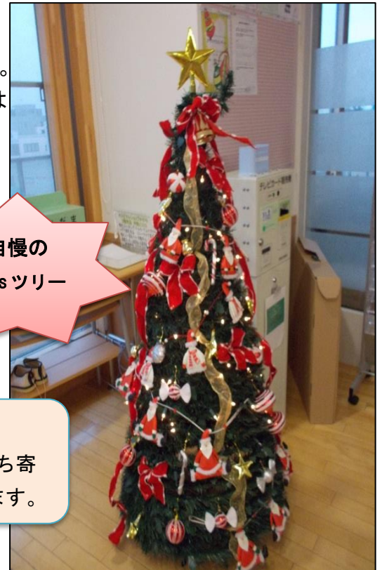
自慢の Xmas ツリー

今月は『当病棟のクリスマス』についてご紹介します。 12月に入り、当病棟でもクリスマスツリーの飾りつけをしました。 キラキラ光るイルミネーションやオーナメントに、患者さんからは『きれいだね。』と声を掛けていただきました。 また、毎年、県立新発田病院附属看護専門学校の学生さんがクリスマスの飾りつけにきています。 写真はその時の様子です。