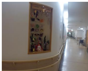
廊下の一角にある 展示スペースです！