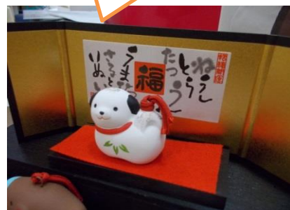
ナースステーション前