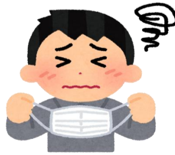
基礎疾患を有する方